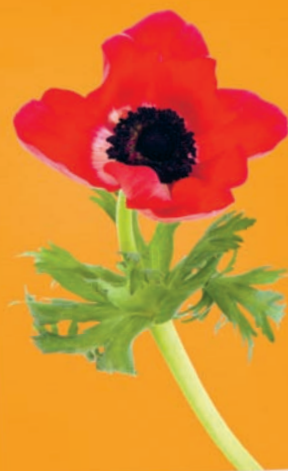
12. Anemon (Anemone coronaria)