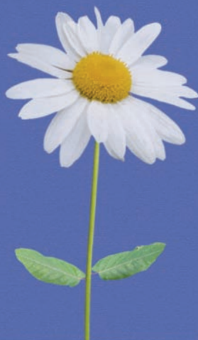
11. Prästkrage (Leucanthemum vulgare)