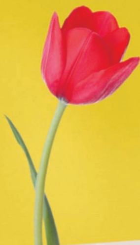
10. Tulpan (Tulipa)